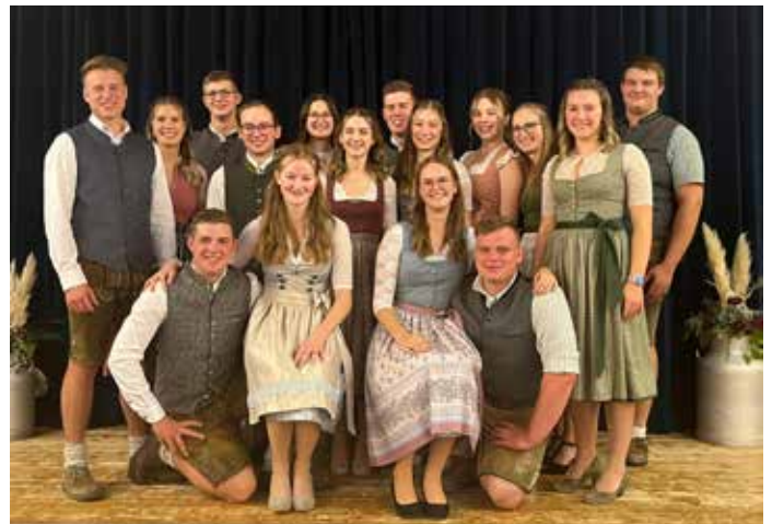
Der neu gewählte Vorstand mit der Bezirksleitung: