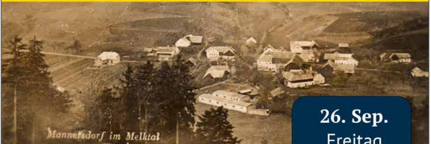
Mannefeldorf im Melktal

WIE WAR DAS BEI UNS? EINE REISE DURCH DIE ZEITGESCHICHTE in Ruprechtshofen, St. Leonhard und Umgebung