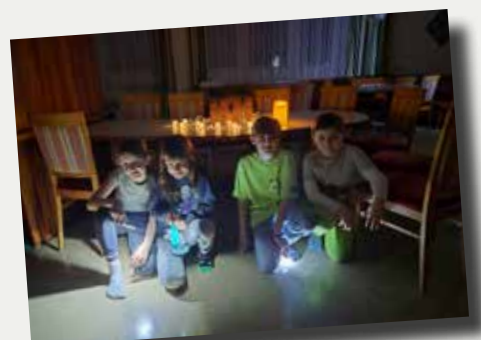
Lesenacht in der Volksschule