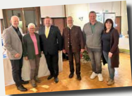
Adventempfang unter dem Motto "Glanzlichter des Jahres"