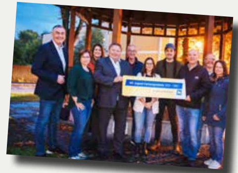
Ruprechtshofen ist Jugendpartnergemeinde

Freiwillige Feuerwehren, Rotes Kreuz, Bücherei, Caritas Werkstatt, Essen auf Rädern, Benedict Randhartinger-Gesellschaft, NÖ Senioren, ÖKB, Landjugend, Verschönerungsverein, Sportschützen, Sportunion, 1. FC Leonhofen