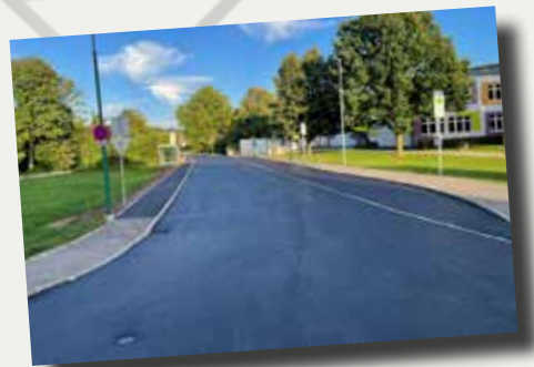
Schulstraße wurde saniert