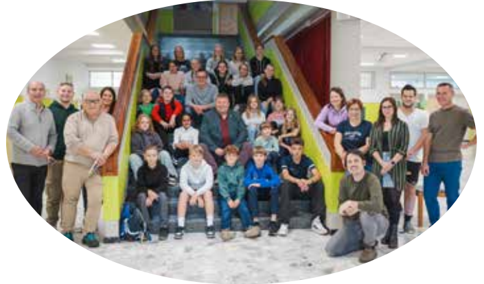
Die Teilnehmerinnen und Teilnehmer des Jugendworkshops 2.0 in der Volksschule Ruprechtshofen mit den Vertreterinnen und Vertretern der beiden Gemeinden sowie der Sportunion Leonhofen

Ziel des Nachmittags war, die Ideen zu vertiefen und neue Vorschläge für attrak-