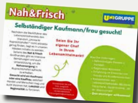
Kaufmann/Kauffrau für Unimarkt-Standort gesucht!