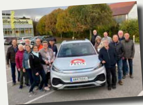
Zahlreiche Fahrer stehen dem FahrMit-Dienst FELIX zur Verfügung