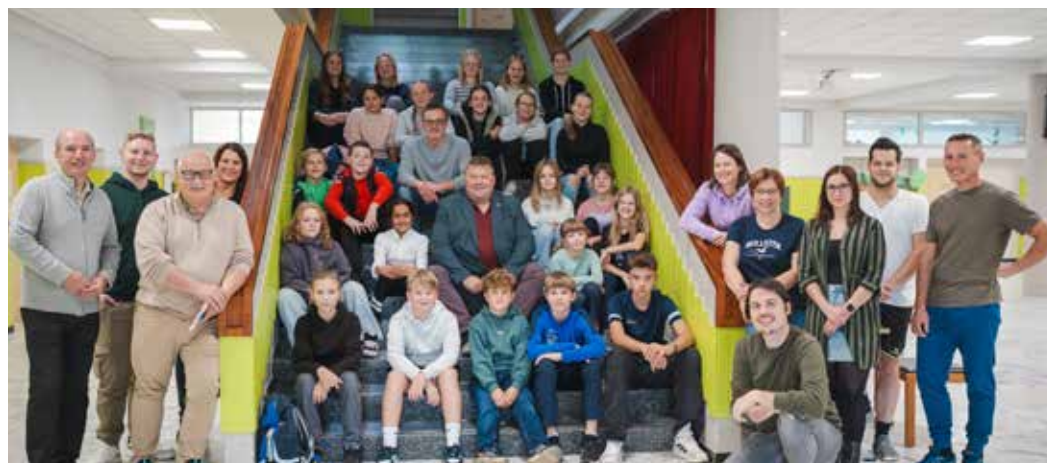
Die Kinder mit den Gemeinde- und Sportunion-Vertretern beim Jugendworkshop in der Volksschule Ruprechtshofen