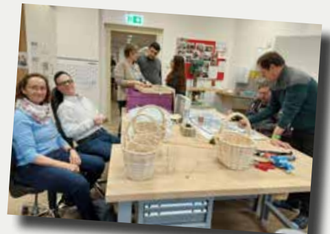
Caritas-Bewohnerinnen und Bewohner bei der Herstellung von Korbbwaren und vielem mehr