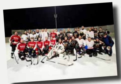
Eishockeyspieler am Eislaufplatz