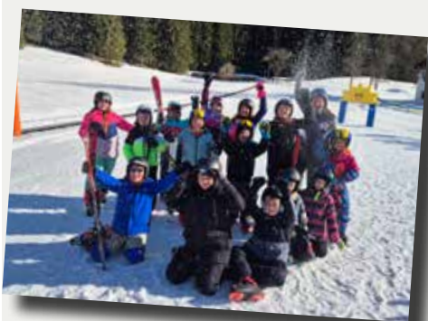
Schitage in der Volksschule