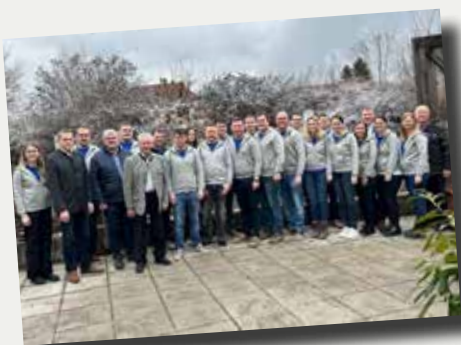
Die Mitglieder vom Club Ruprechtshofen