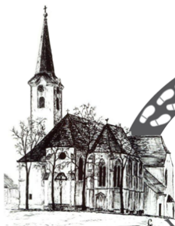
St. Leonhard am Forst