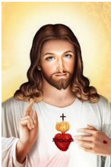
Heiligstes Herz Jesu bitte für uns